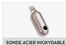
SONDE ACIER INOXYDABLE